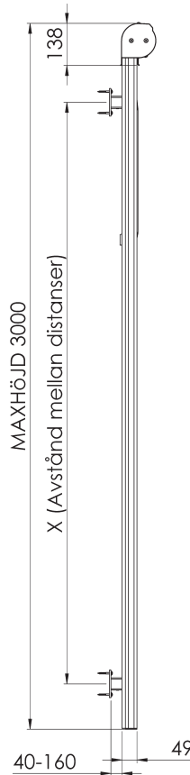
Byggmått sidovy uppfäld